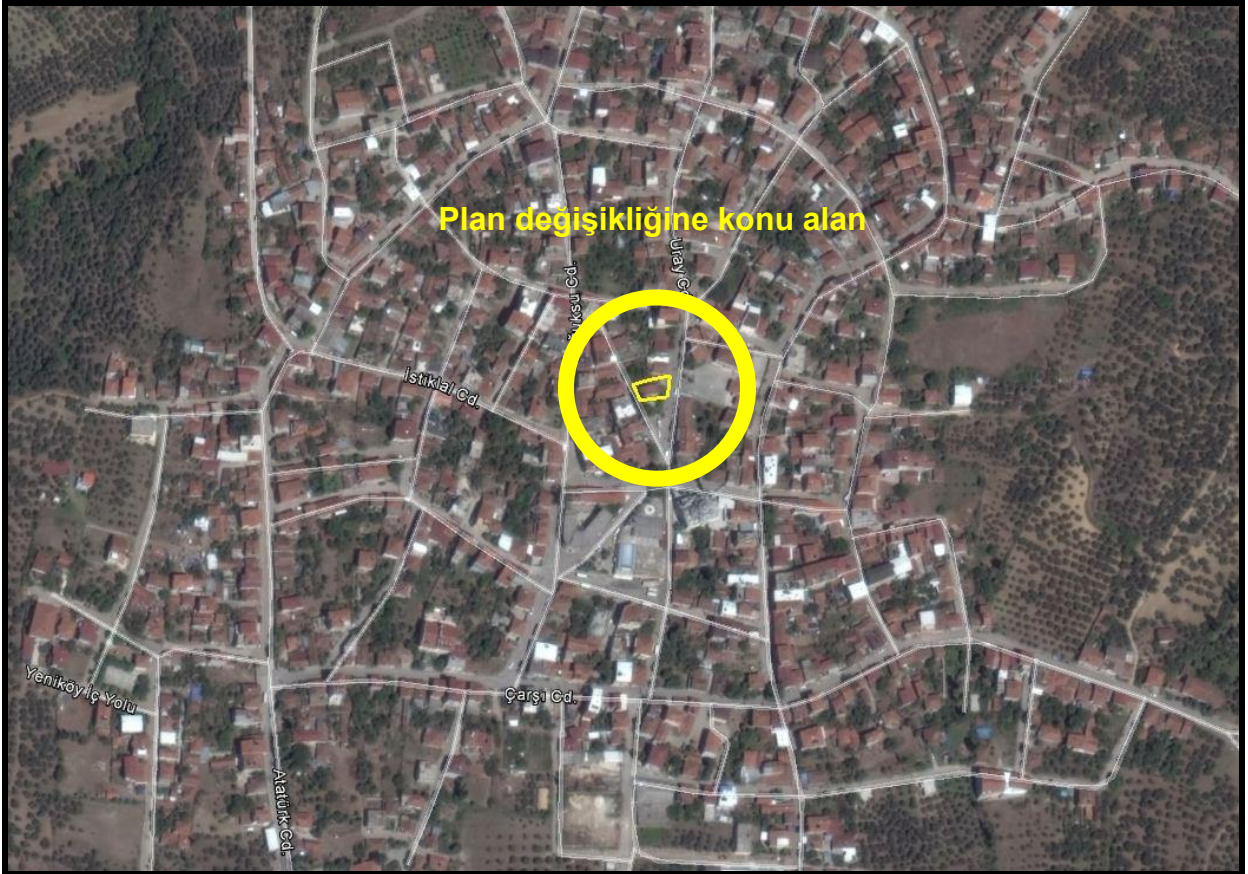
Şekil 1: 1772 Nolu Parselin Konumu

Bursa İli, Orhangazi İlçesi, Yeniköy Mahallesi, 1772 Nolu Parsel; Yeniköy Merkez Camii’nin 75 metre kuzeyinde konumlanmış olup, doğu yönünde Uray Caddesine ve batı yönünde Yeniköy İç Yolu cephelidir.